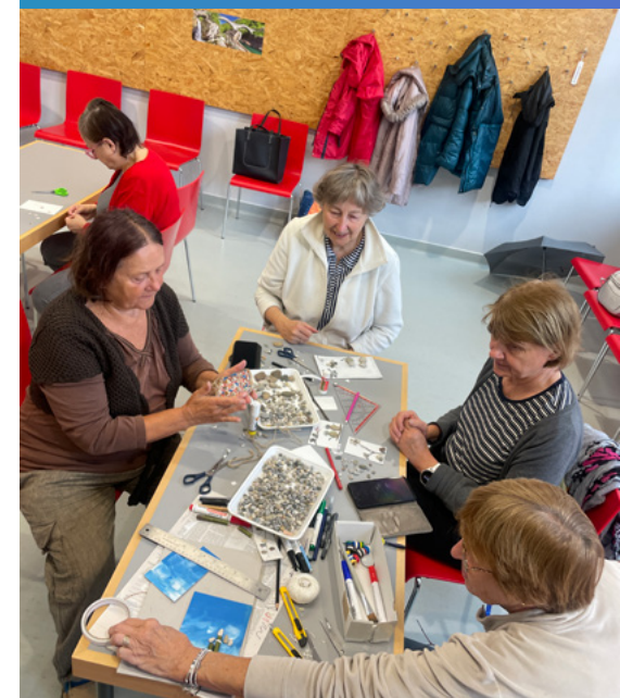
Rodinné centrum K2

V budově jedné z pražských knihoven se pod taktovkou Rodinného centra K2 jednou za měsíc odehrávají mezigenerační dílny. U jednoho stolu sedí devadesátiletá paní a skládá papírovou hvězdu, o pár míst dál si maminka s malým dítětem zkouší úplně totéž a mezi nimi se rozbíhá rozhovor, který začal u lepidla a skončil u životních příběhů. Mezigenerační dílny nejsou kurz ani klub – jsou otevřeným prostorem, kde se lidé různých generací potkávají přirozeně, bez registrace, bez tlaku a bez očekávání. Právě v této nenápadnosti vznikají vztahy, které dávají komunitě smysl a život.