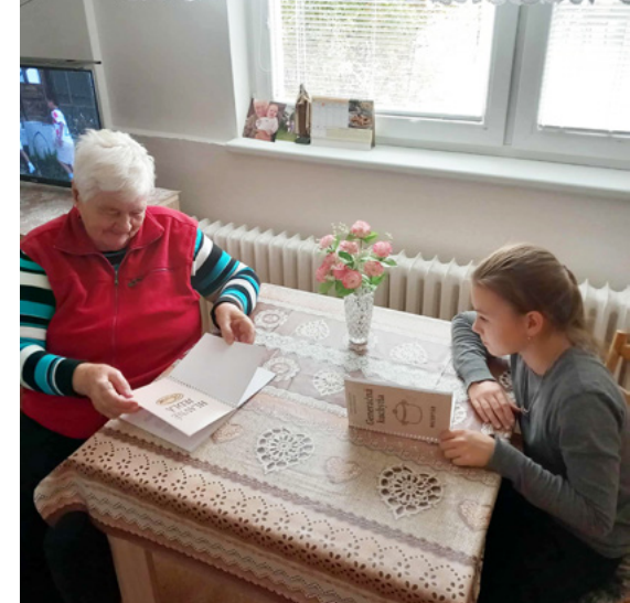
Prepojenie generácií v Harmónii

Od začiatku sme vedeli, že nechceme robiť jednorazové stretnutie. Chceli sme skutočné prepojenie generácií – také, ktoré seniorom