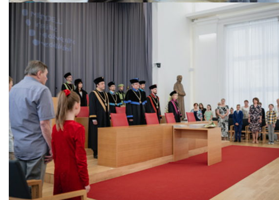
Mezigenerační dobrovolnický program MOST