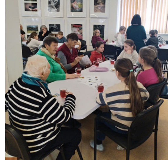
Digitálna medzigeneračná univerzita

Takto vyzerá projekt, ktorý reaguje na jednu z veľkých výziev súčasnosti. Spoločnosť starne a zároveň sa rýchlo digitalizuje. Kým pre mladších ľudí sú technológie prirodzenou súčasťou života, pre mnohých seniorov predstavujú svet, v ktorom sa cítia neistí. Svet, v ktorom majú pocit, že strácajú kontrolu, samostatnosť aj možnosť plnohodnotne sa zapájať do spoločenského diania. Digitálna priepasť sa s vekom prehľbuje a spolu s ňou rastie riziko sociálneho vylúčenia.