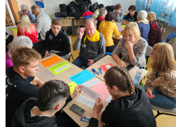
Vidiecka žena roka – Líderka roka