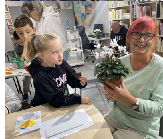
Ruka v ruke