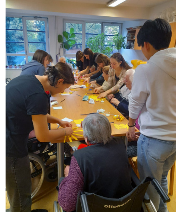
TROJLÍSTEK sblížení tří generací

Účastníci programu jsou velmi rozmanitou skupinou, ale v jádru se opakuje několik základních schémat. Na jedné straně stojí rodiny, které v Brně nikoho nemají, protože se sem přistěhovaly za studiem nebo prací, a jejich vlastní prarodiče žijí daleko, třeba až na Slovensku nebo v opačném koutě republiky. Takové rodiny sice mají babičku na telefonu nebo je párkrát do roka navštíví, ale